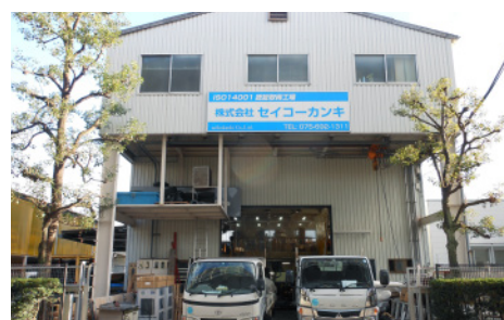
株式会社 セイコーカンキ 本社

許認可取得 建設業登録許可 一般建設業 管工事業 機械器具設置工事業 ISO14001取得 KESステップ1取得 ISO14001内部監査員 産業廃棄物収集・運搬