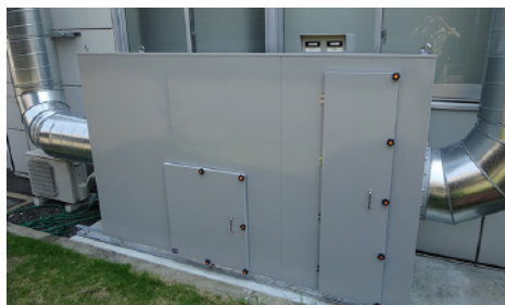
環境設備 空調設備

産業空調設備・集塵設備工事・エージング・熟成工事・給排気設備工事・環境試験工事 他