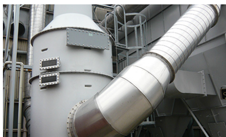
環境設備 集塵設備